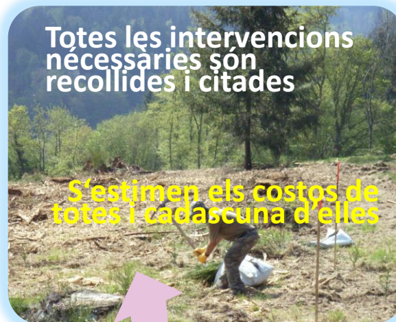
PRESSUPOST PROVISIONAL 2018 - 2037

És possible establir uns ingressos esperats (pg 9)